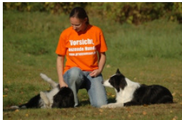
Trainingspause mit Pitú (links) und Grappa.

Tricks und schöne Fußballarbeit zu einer Choreographie zu einer selbst gewählten Musik zusammenbasteln. Dann sieht es so aus, als sei der Hund musikalisch. Das ist er zwar nicht, aber Mensch will ja schließlich auch was zu tun haben. Beim Dogdance steht der Hund im Mittelpunkt. Trotzdem ist das Geheimnis einer gelungenen Choreographie eine gute Teamarbeit.