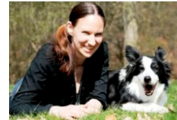
Grappamaus und ich sind ein gut eingespieltes Team.

Wichtigstes Hilfsmittel für das Training: ein Clicker. Wer seinen Hund mit positiver Bestärkung trainiert, gibt ihm das Gefühl, dass er die guten Ideen hat, denn der Hund fällt bewusste Entscheidungen, um ein „Klick!“ zu bekommen. Dagegen bekommt ein Hund, der nur einem Wurstzipfel folgt oder sein Bällchen angeiert, nicht mit, was er tut. Sinnvoll ist speziell am Anfang das Targettraining mit verschiedenen Zielen: Targetstab, Handtarget, Bodentarget, Pfotentarget